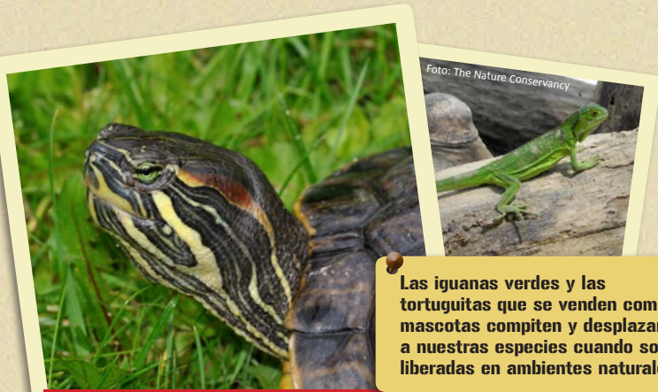
Las iguanas verdes y las tortuguitas que se venden como mascotas compiten y desplazan a nuestras especies cuando son liberadas en ambientes naturales.