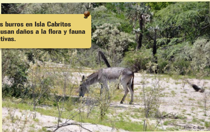
Los burros en Isla Cabritos causan daños a la flora y fauna nativas.