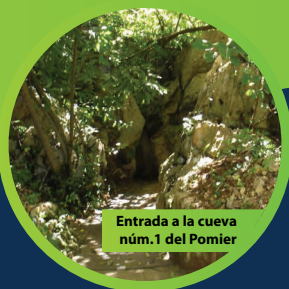
Entrada a la cueva núm. 1 del Pomier

Las Cuevas del Pomier y la Cueva Los Patos son dos lugares de República Dominicana con características singulares. Además de su belleza paisajística y de tener recursos arqueológicos importantes, son sitios especiales para la conservación de los murciélagos. Estos dos ecosistemas dan refugio a varias especies de estos mamíferos voladores, algunas de ellas consideradas como amenazadas en la Lista Roja Nacional y por la Unión Internacional para la Conservación de la Naturaleza. Por brindar los murciélagos numerosos servicios ecosistémicos (polinización de plantas, dispersión de semillas y control de poblaciones de insectos), Cuevas del Pomier y Cueva Los Patos constituyen lugares de mucha importancia para la protección y uso sostenible de la biodiversidad.