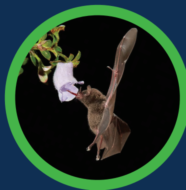
Murciélagos polinizando plantas